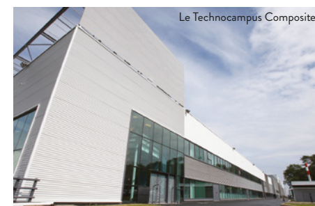
Le Technocampus Composites